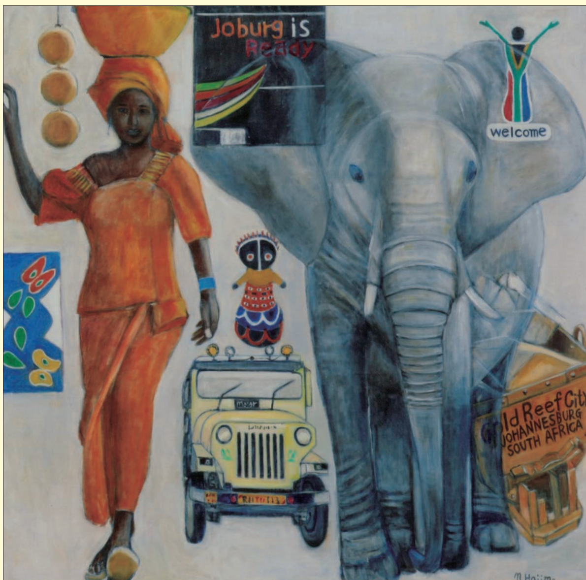
In South Africa (南アフリカ) 新世紀美術協会会員・日本美術家連盟会員 西川 肇