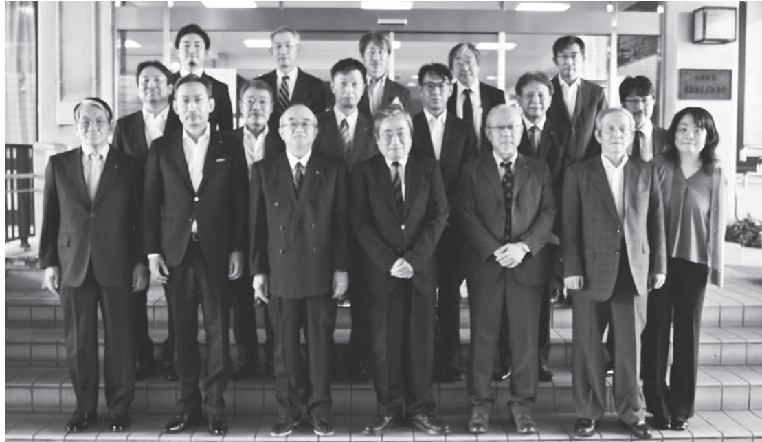
一般社団法人大阪市学校歯科医会 令和3年度・4年度 役員名簿