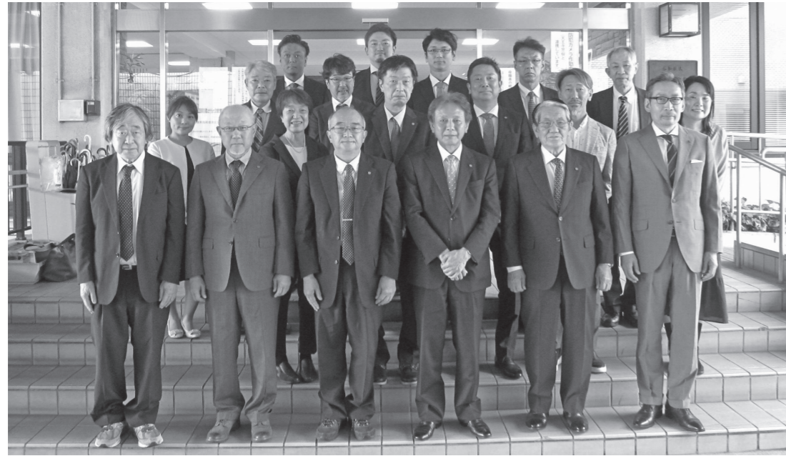
一般社団法人大阪市学校歯科医会 令和5年度・6年度 役員名簿